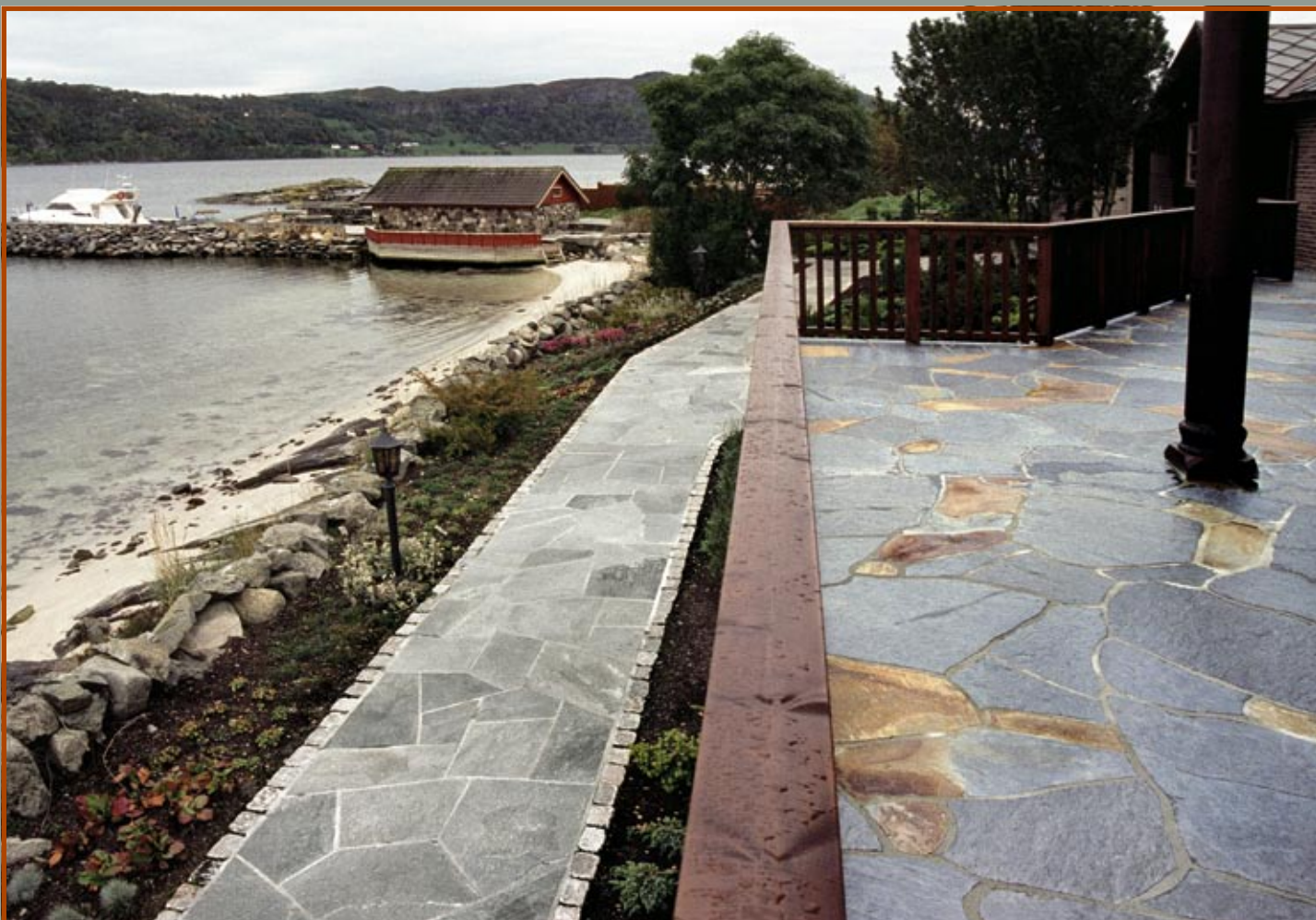
Terrasse i Ottaskifer og gangvei i Oppdalskifer.