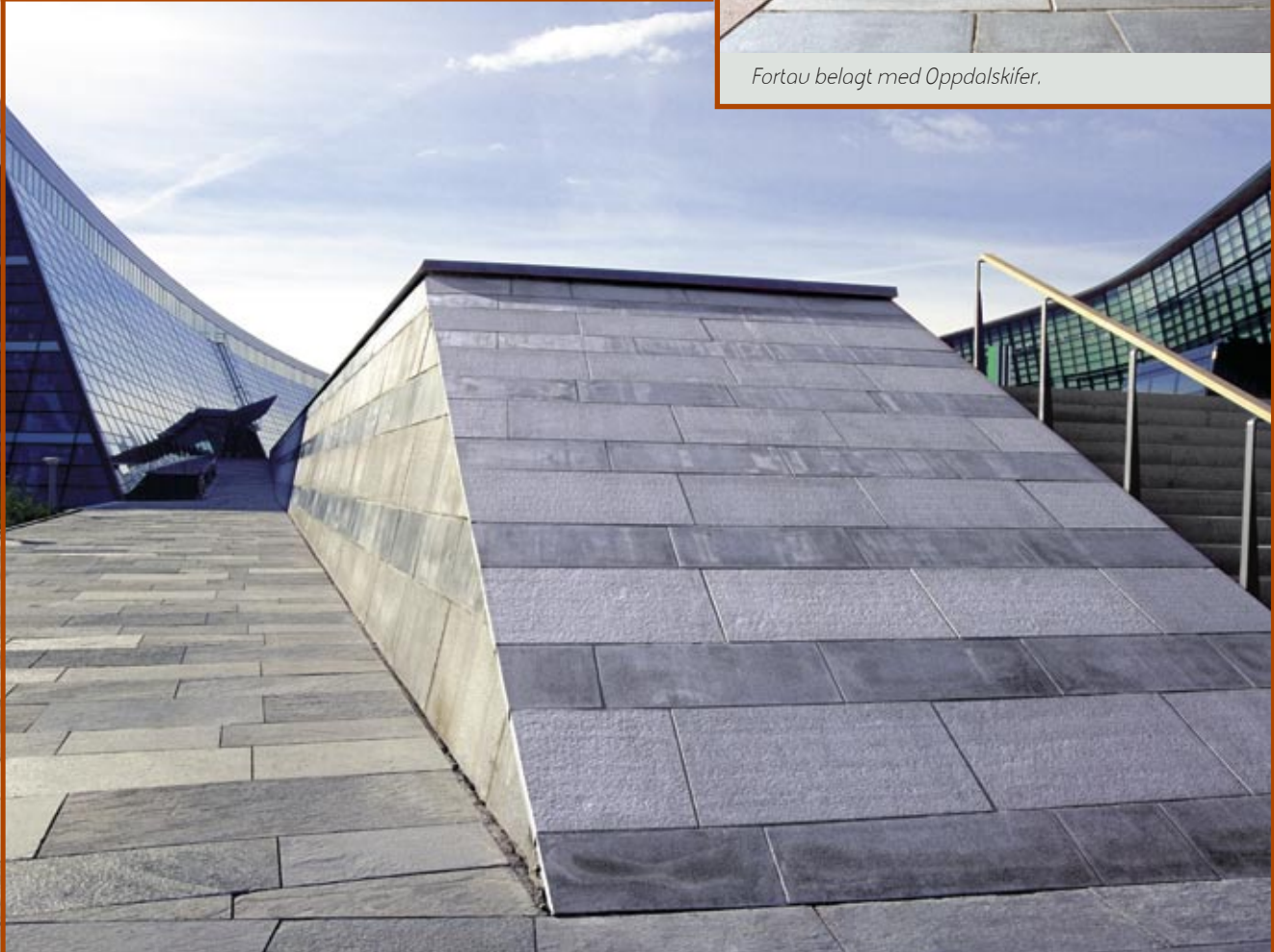
Belegning i Oppdalskifer.