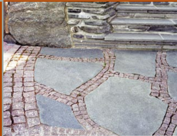
Belegning Altaskifer kombinert med granitt.

Skiferen tåler alle påkjenninger i vår daglige bruk - livet ut. Overflaten er sklisikker og 100% vedlikeholdsfri.