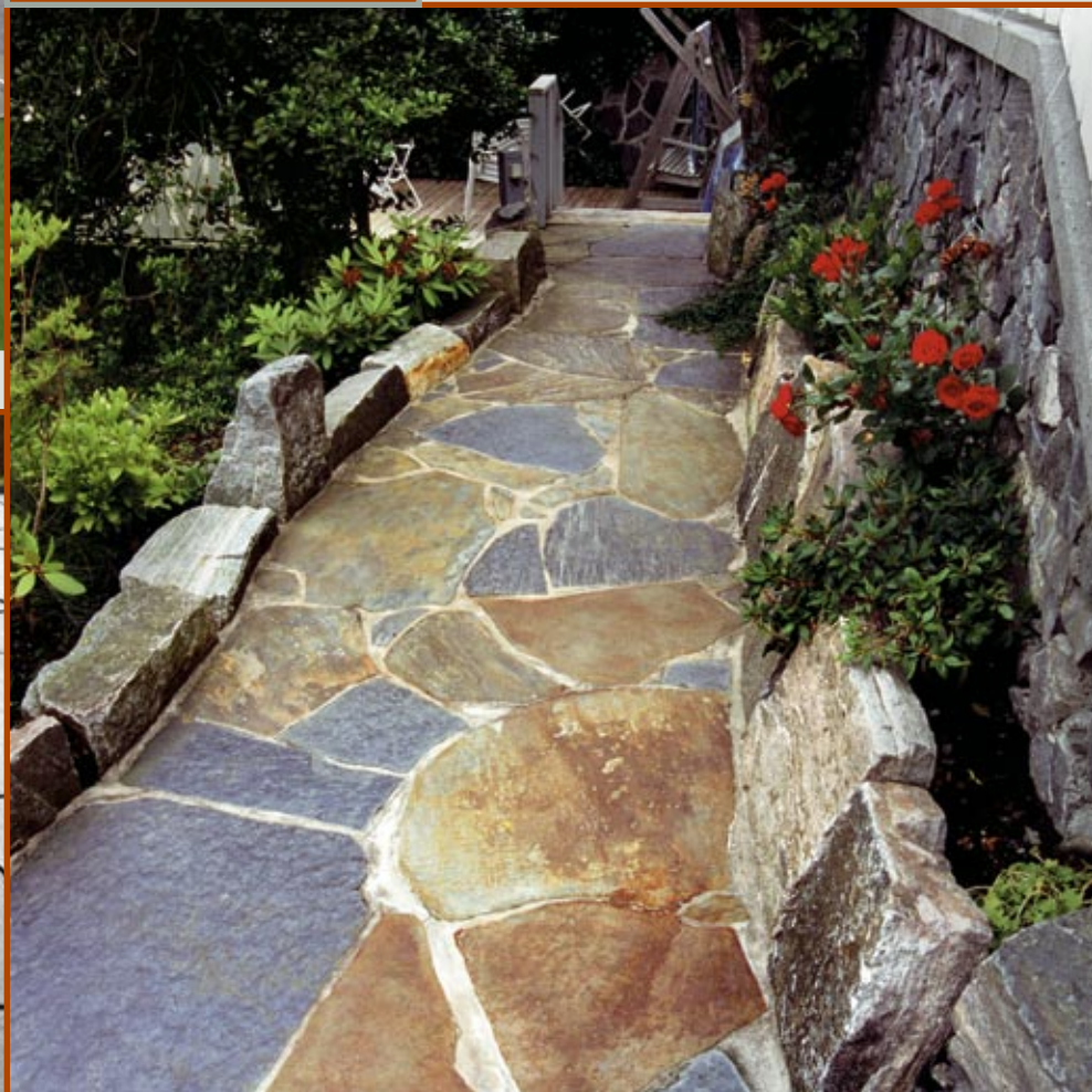
Hellegang i Ottaskifer.