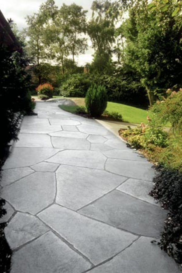
Hellegang i Oppdalskifer.