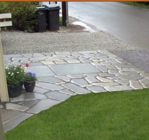
Kjørespor med belegning i Oppdalskifer.