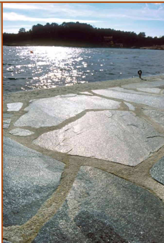
Belegg i Oppdalskifer.