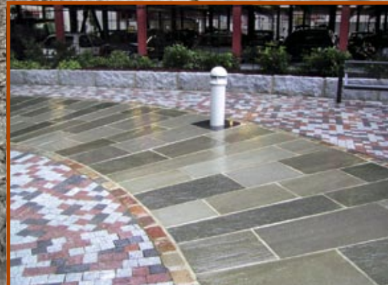
Belegning i Oppdalskifer kombinert med granitt.