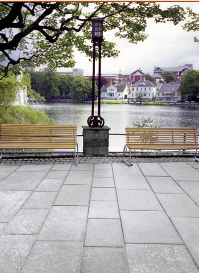
Belegning i Altaskifer.