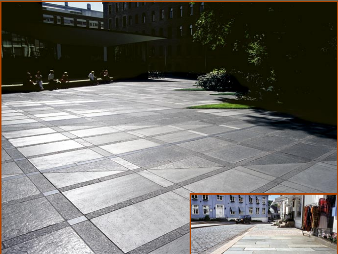
Belegning: Oppdal- og Ottaskifer i kombinasjon med Larvikitt.