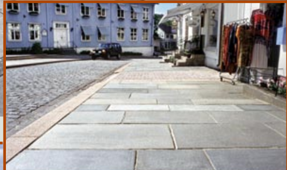
Fortau belagt med Oppdalskifer.