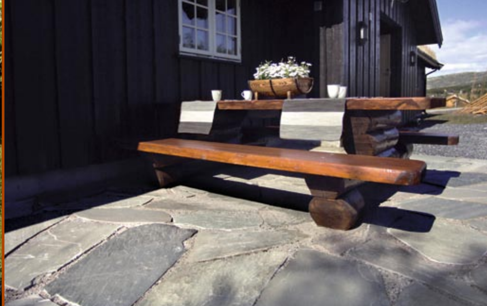
Belegning i Oppdalskifer.

Norsk natursten er slett ikke ensfarget grå og trist. Fargespillet i skifer er unikt og spesielt. Materialet har alle positive miljøfaktorer og er blitt en norsk eksportvare i betydelig målestokk.