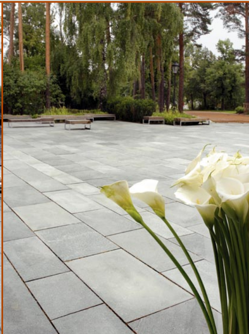
Belegning i Altaskifer.