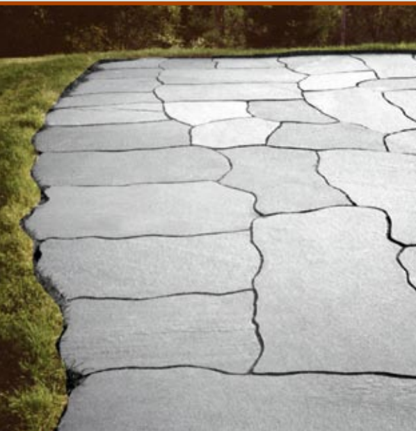
Uteplass i Oppdalskifer.